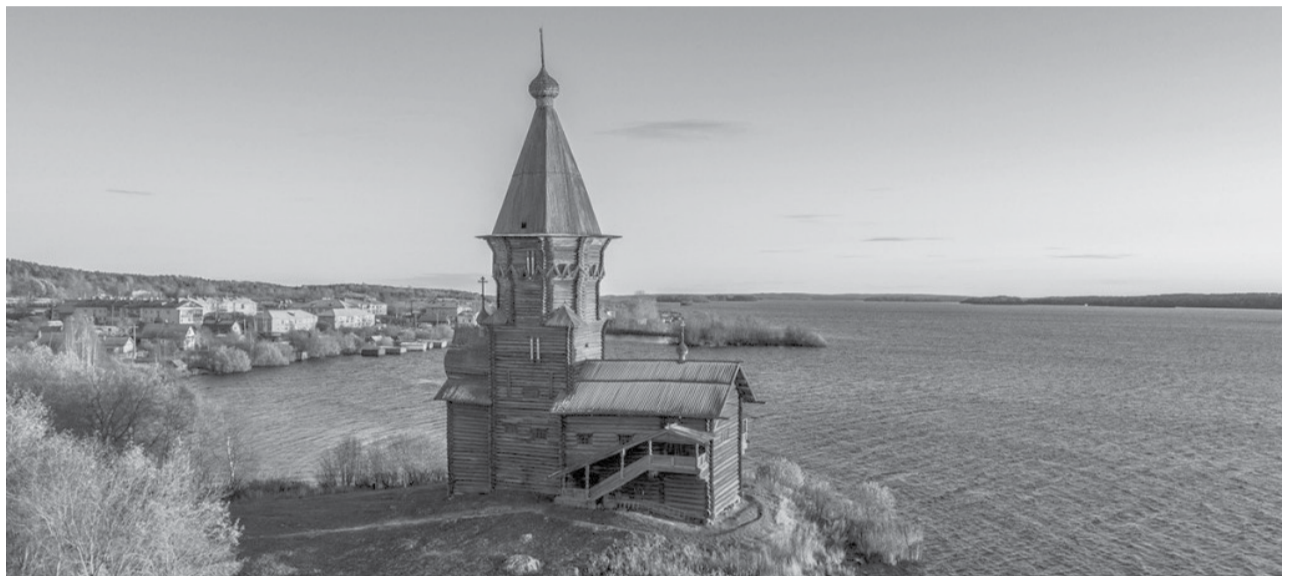
Успенская церковь.

Высота Успенской церкви 41 метр. Выше только один деревянный храм в России – Вознесенская церковь в селе Пиялы Архангельской области. Но взмывающая вертикаль Успен-