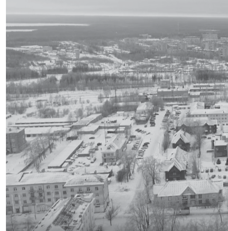
В следующем году в Карелии начнет работу новая региональная программа, совместно

В 2020 году в республике запускается проект «Наш бюджет».