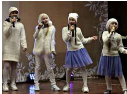
Вокально-хореографическая студия «Поколение»