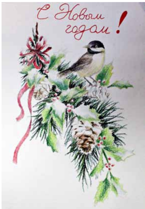
«Новогодняя открытка», Вероника Орлова