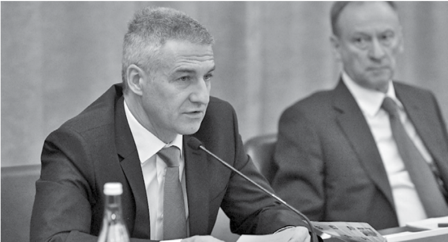
Итоговое в 2019 году заседание госкомиссии по подготовке к столетию Карелии.