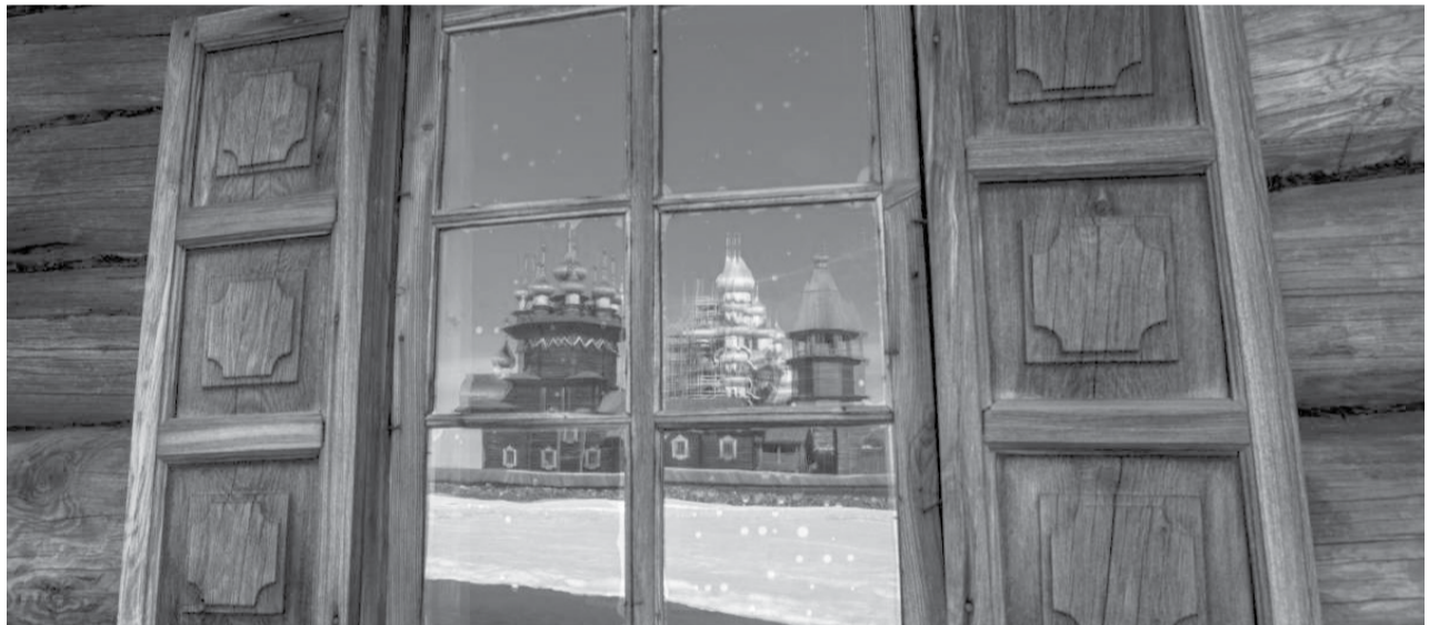
Отражение кижского ансамбля в окнах дома Ошевнева на острове Кижь.

ского храма настолько впечатляет отнюдь не из-за многометровой высоты – здесь работают совсем другие законы и архитектурные тайны.