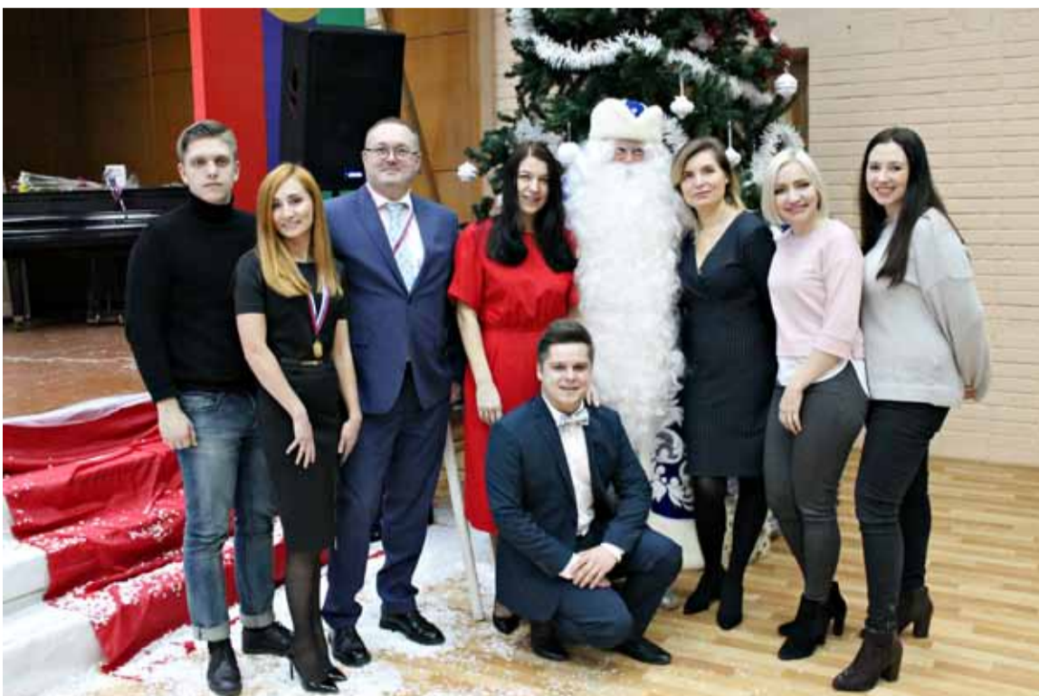
Коллектив Прионежского РЦК